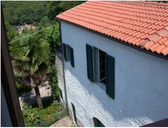
Das Haus von oben ...