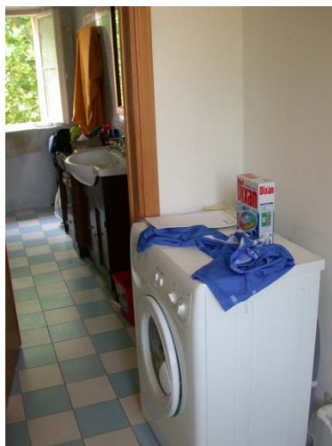
Bade-Zimmer mit Wasch-Automat