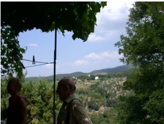
Ausblick von der Terrasse