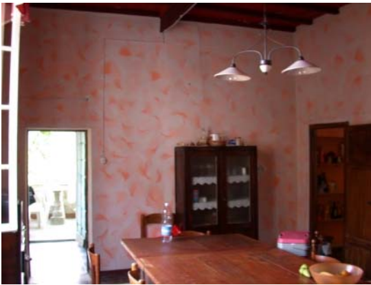
Das Ess-Zimmer mit Terrasse im Hintergrund