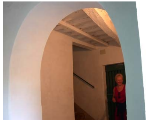
Entrée vom Hof her