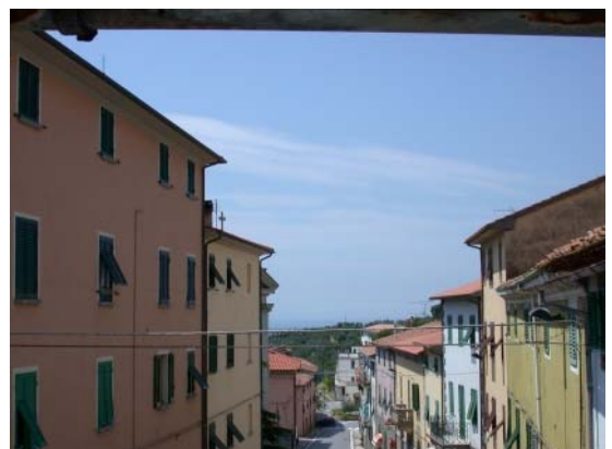
Blick auf die Dorfstrasse im Hintergrund das Meer