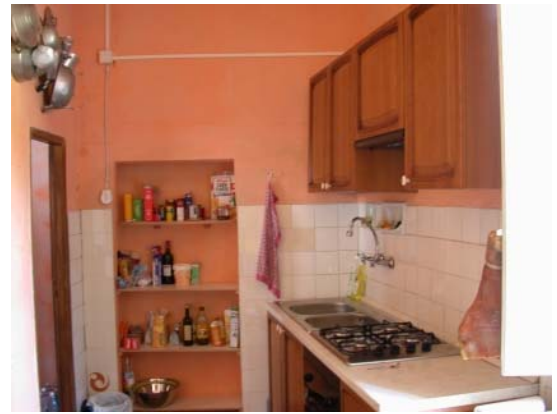
Küche mit Türe zum Esszimmer