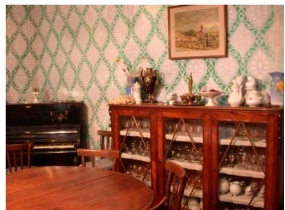
Salon und Büro Carla und Maurizio