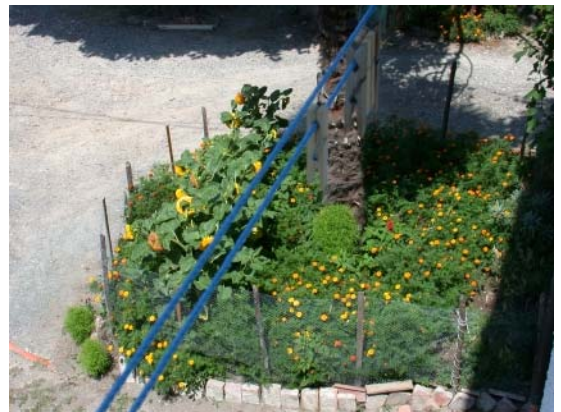
Blick in den Hof