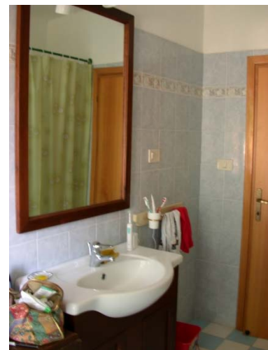
Bade-Zimmer mit Dusche