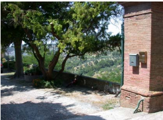
Eingang zum Hof